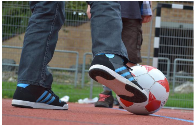
Freunde braucht man nicht nur zum Fussballspielen.