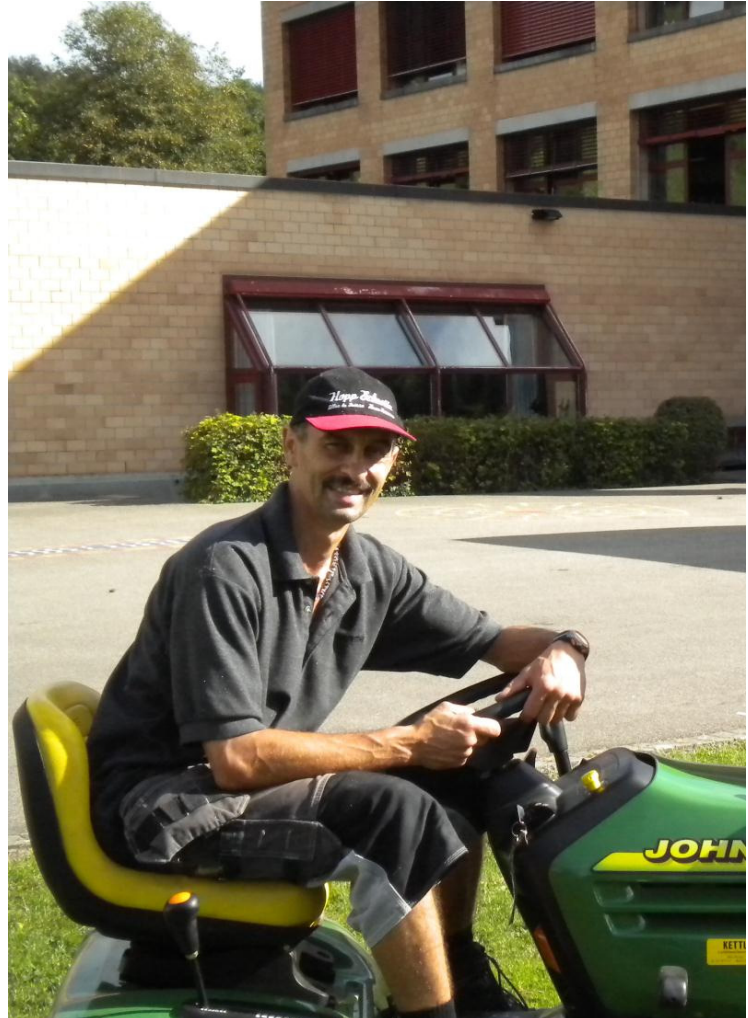
Unser neuer Abwart sitzt am liebsten auf dem Rasenmäher